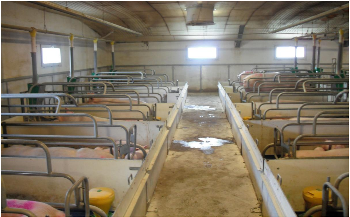
Készítette: Szalma Laura