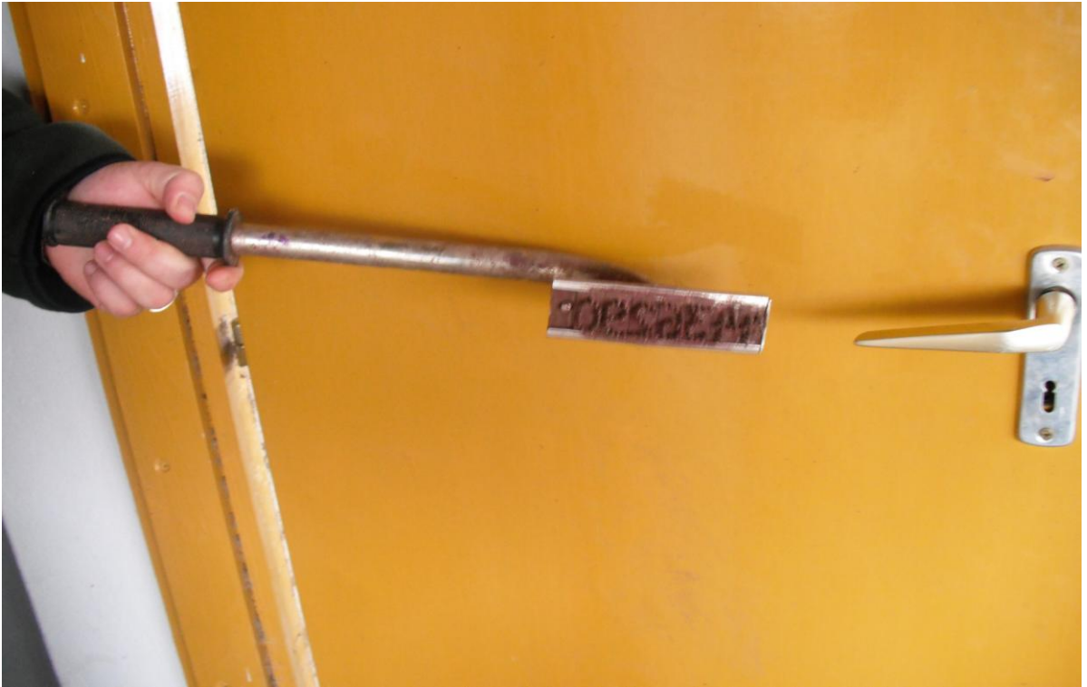
Készítette: Szalma Laura